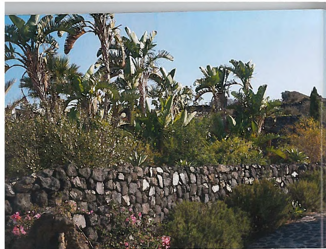
SOPRA, UNA COLLEZIONE DI PIANTE DALLA FORMA RAGGIATA ACCOMPAGNA IL VISITATORE ALLA SCOPERTA DEL GIARDINO SOTTO, UN PARTICOLARE DELLA BOUGAINVILLEA ABOVE, A COLLECTION OF PLANTS WITH A RADIAL SHAPE ACCOMPANIES VISITORS AS THEY DISCOVER THE GARDEN, BELOW, A DETAIL OF THE BOUGAINVILLEA